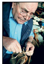
Fotó: Kovács Bence