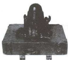
10% kőn. Kármánok. XVII. század

A kezdeményezés eredendő célja az volt, hogy Tata város természeti környezetéhez, történelméhez, műemlékeihez jól illeszkedő, turisztikai és kulturális értelemben is figyelemre méltó eseménnyel idézze fel Tata török kori életét, történelmi eseményeit.